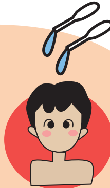
ポリオ予防ワクチン2本(1人分)に相当

を寄付するだけでなく接種の意識づけや環境を整える支援も併せて行っています。活動の詳細は下記ホームページをご覧ください。