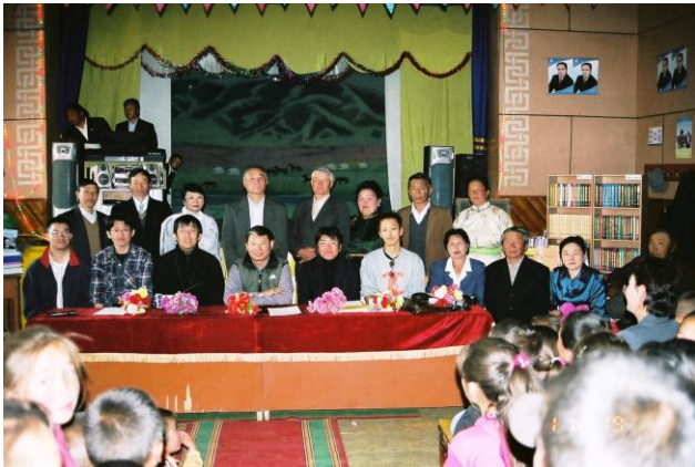
▲贈呈式の様子(2004年／第1次)

短期間ではありますが、マルチン郡の皆さんと様々な交流を図る予定です。ミッションを無事に遂行し、全員が元気で日本に帰ってくることを願います。