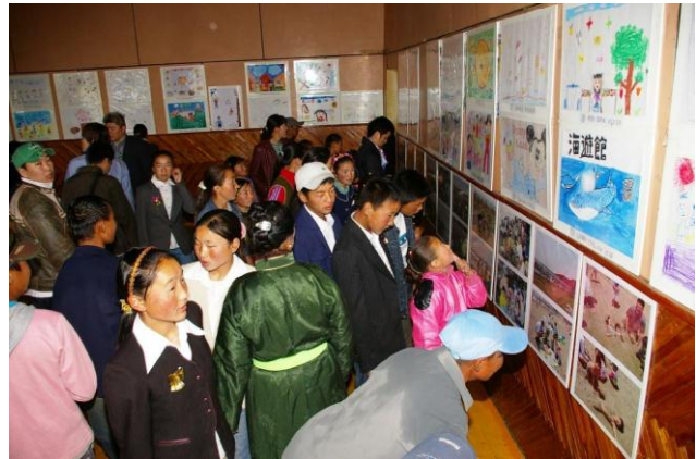
▲日本の子どもたちの絵画展(2007年／第2次)